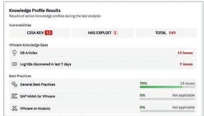
Übersicht über den allgemeinen Best-Practice-Zustand und vorhandene Sicherheitslücken